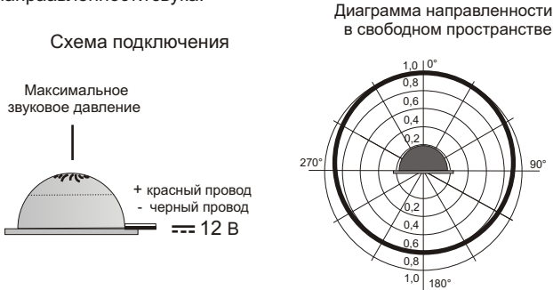
Рис.2 Схема подключения и диаграмма направленности звука оповещателя.

5.3. На рис.2 показана схема подключения и диаграмма направленности звука.