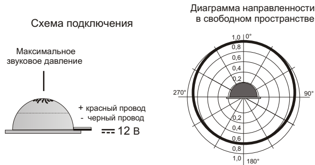
Рис.2 Схема подключения и диаграмма направленности звука оповещателя.

5.3. На рис.2 показана схема подключения и диаграмма направленности звука.