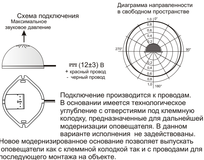
Рис.2 Схема подключения и диаграмма направленности оповещателя.

5.3. На рис.2 показана схема подключения и диаграмма направленности звука оповещателя